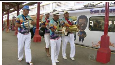
Central do Brasil