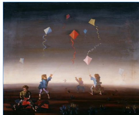
Meninos soltando pipas (1947)

OBS. Os textos expressam a opinião de seus autores, não necessariamente coincidente com a dos coordenadores do Blog e dos participantes do Fórum Intersindical. A cada reunião ordinária, os textos da Coluna Opinião do mês são debatidos, suscitando divergências e provocando reflexões, na perspectiva de uma arena democrática, criativa e coletiva de encontros de ideias em prol da saúde dos trabalhadores.