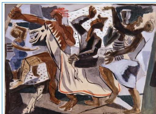
Bumba-meu-boi (1942). Painel em guache. Série Os Músicos (Rádio Tupi, Rio de Janeiro/RJ). O PINTOR PORTINARI