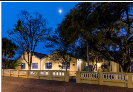
Museu Casa de Portinari (Foto: Gian Claudio Biancuzzi) A CRIANÇA PORTINARI