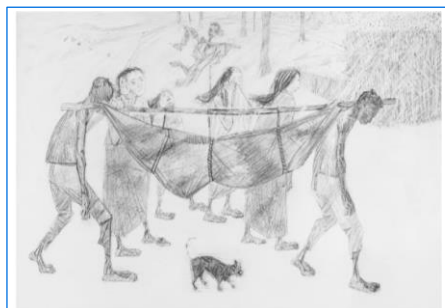
Enterro na Rede (1955) O DESENHISTA PORTINARI

O POETA PORTINARI DEUS DE VIOLÊNCIA Os retirantes vêm vindo com trouxas e embrulhos Vêm das terras secas e escuras; pedregulhos Doloridos como fagulhas de carvão aceso Corpos disformes, uns panos sujos, Rasgados e sem cor, dependurados Homens de enorme ventre bojudo Mulheres com trouxas caídas para o lado Pançudas, carregando ao colo um garoto Choramíngando, remelento Mocinhas de peito duro e vestido roto Velhas trôpegas marcadas pelo tempo Olhos de catarata e pés informes Aos velhos cegos agarradas Pés inchados enormes Levantando o pó da cor de suas vestes rasgadas No rumor monótono das alparcatas Há uma pausa, cai no pó A mulher que carrega uma lata De água! Só há umas gotas — Dá uma só Não vai arribar. É melhor o marido E os filhos ficarem. Nós vamos andando Temos muito que andar neste chão batido As secas vão a morte semeando.