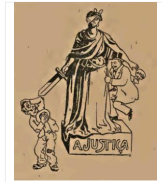
Terra Livre, 27/02/1913, ano I, n 03, p.4 Lisboa: Grupo Editor Terra Livre.